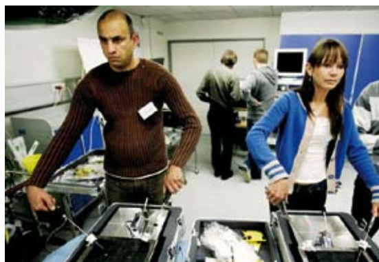
Kursister på Minimalinvasivt Udviklingscenter modul 1 opøver færdigheder på laparotrænere. Kirurgisk Øvelaboratorium, Foulum-Viborg.

Kursistens vidensniveau vurderes ved hjælp af en multiple choice (MC)-test, og de motoriske færdigheder evalueres dels ved hjælp af en afsluttende visuel